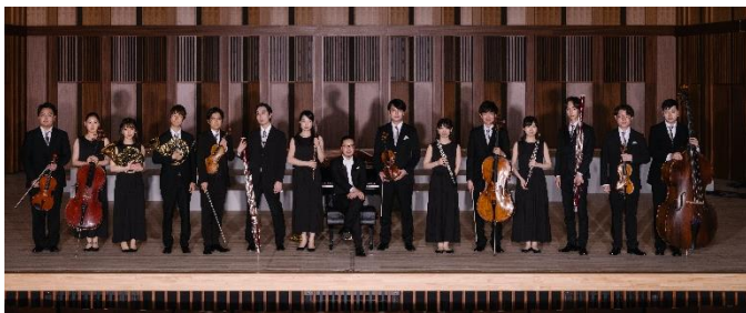
ジャパン・ナショナル・オーケストラ