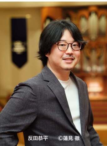
反田恭平

< お問い合わせ > 横浜みなとみらいホール TEL:045-682-2020 Mail:mmh@yaf.or.jp