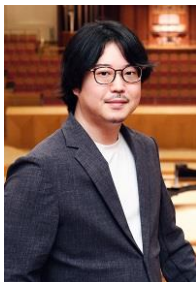
反田恭平