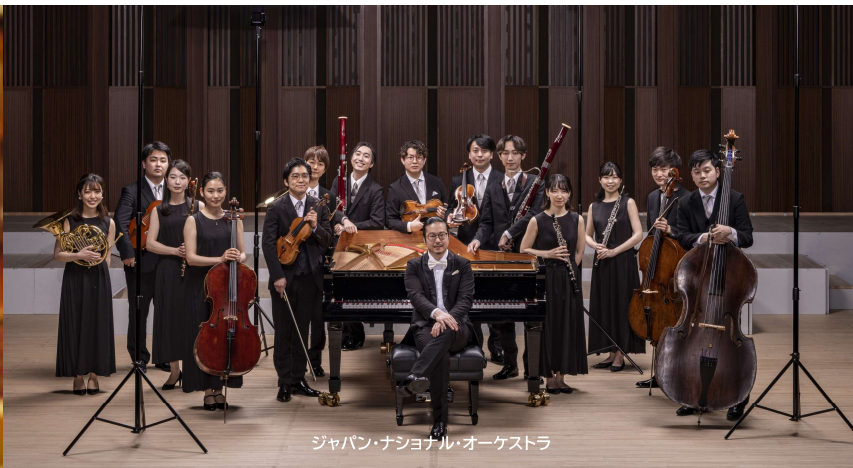
ジャパン・ナショナル・オーケストラ