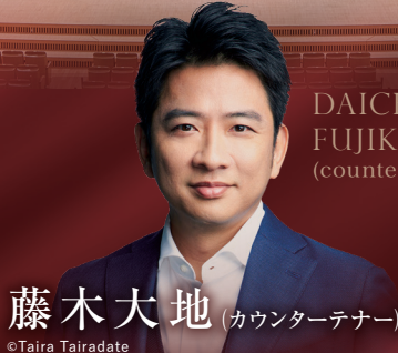
DAICHI FUJIKI (countertenor)