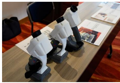
レーザー網膜投影機器「レティッサオンハンド」