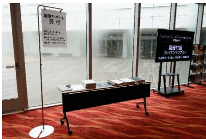
公演プログラムの音声読み上げ動画