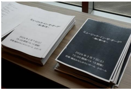
大文字プログラム(白背景、黒背景)