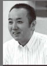
演出・台本 今井 伸昭