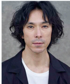
SHUTO Yasuyuki 首藤康之

15歳で東京バレエ団に入団、19歳で主役デビュー。数々の古典作品から、モリス・ベジャール振付「ボレロ」、マッシュー・ポーン演出・振付「SWAN LAKE」など、世界的現代振付家の作品に数多く主演。2004年に退団後も、中村恩恵、シディ・ラルビ・シエルカウイ、串田和美など、国内外の振付家、演出家の作品に出演するほか、自らプロデュース公演も上演。また、ピナ・バウシュ芸術監督のNRW国際ダンスフェスティバルなどの海外公演にも多数出演。近年は、映画、TVドラマや渋谷コケーン歌舞伎に出演するなど、表現の場を拡げている。第42回舞踊批評家協会賞、第62回芸術選奨文部科学大臣賞など受賞多数。