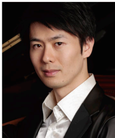
FUKUMA Kotaro 福間洵太郎

ピアノ パリ国立高等音楽院、ベルリン芸術大学で学ぶ。20歳でクリーヴランド国際コンクール優勝（日本人初）およびシヨパン賞受賞。これまでにカーネギーホール、リンカーンセンター、ウイグモアホール等でリサイタル他、クリーヴランド管、イスラエル・フィルなど海外の著名オーケストラと数多く共演。 2016年にはN響との共演や、7月にネルソン・フレイレの代役として急遽、ソビエト指揮・トゥールーズ・キャピトル管の定期演奏会において、ブラームスの協奏曲第2番を演奏し喝采を浴びた。これまでに『シヨパン〜LEGACY〜』など12枚のCDをリリース。 ベルリン在住。オフィシャル・サイト http://www.kotarafukuma.com